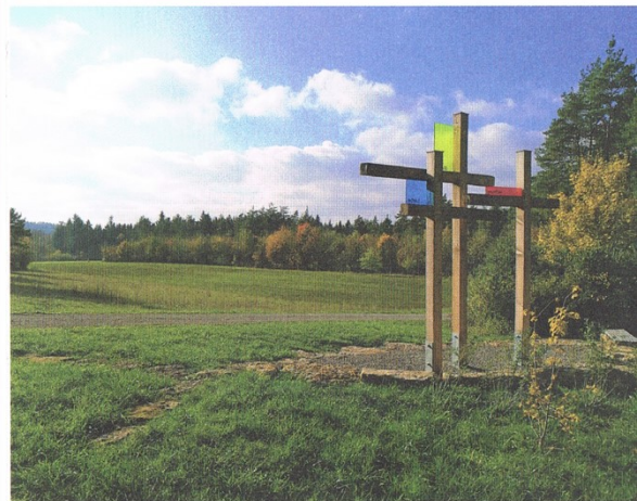
Pfalzgrafenweiler-Neunuifra & Haiterbach